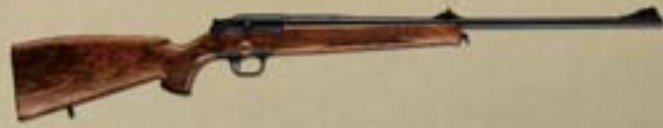
Repetierbüchse R 93 Basismodell/Attaché